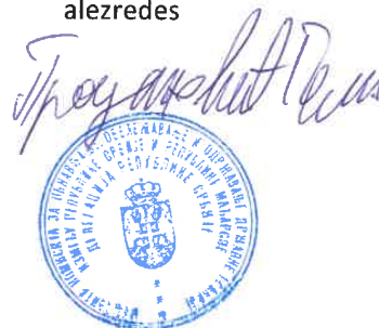
Goran Prodanović alezredes

A Vegyesbizottság szerb küldöttségének elnöke: